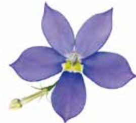
グローイングパープル