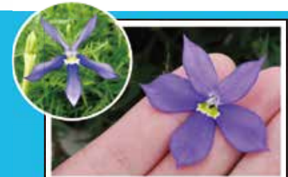
左:一般品種 右:グローイングパープル